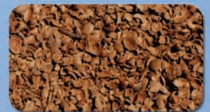
Gusci di mandorle, nocciole e pinoli - Almond, hazelnut and pine shells