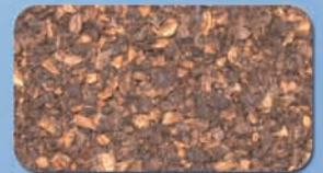
Sansa di olive Olive Husks