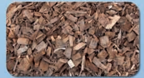
Cippato Wood chips